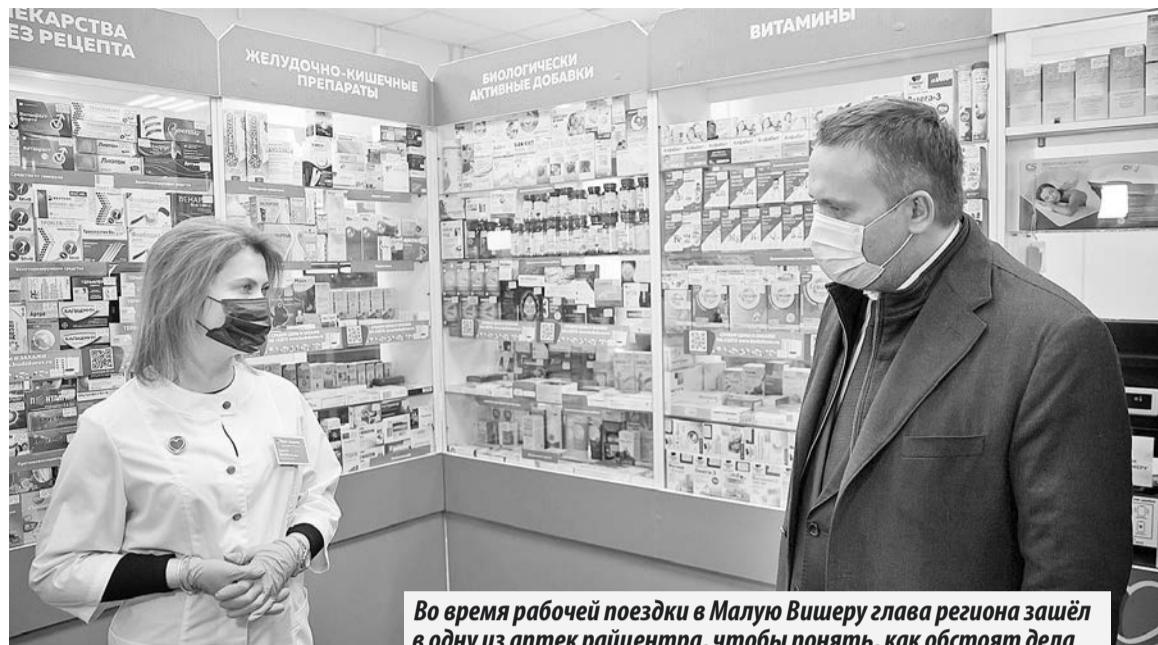
Во время рабочей поездки в Малую Вишеру глава региона зашёл в одну из аптек районного центра, чтобы понять, как обстоят дела со спросом и наличием лекарств.