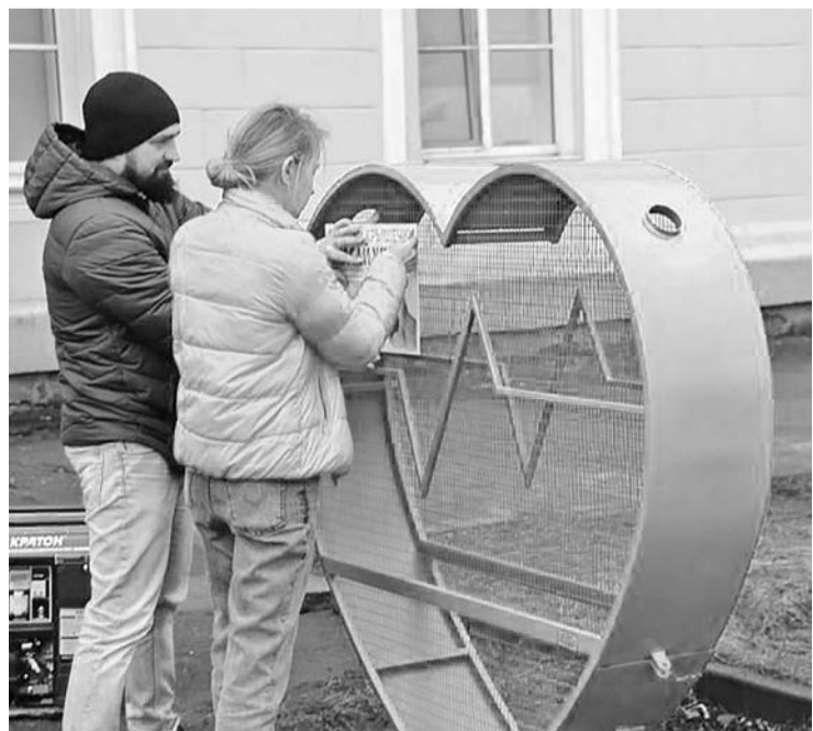
«Эколокатор» в первую очередь известен своим проектом «Сердечные крышечки».

За время работы в центр импортозамещения поступило 33 заявки, требующих проработки. По вопросам семи предприятий решения найдены, вопросы ещё восьми – в высокой степени готовности.